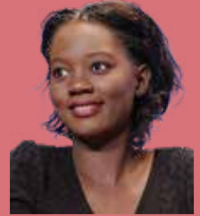
Rama Yade Ancien ministre

« Le fait de devoir passer devant la statue de Colbert est une micro agression »