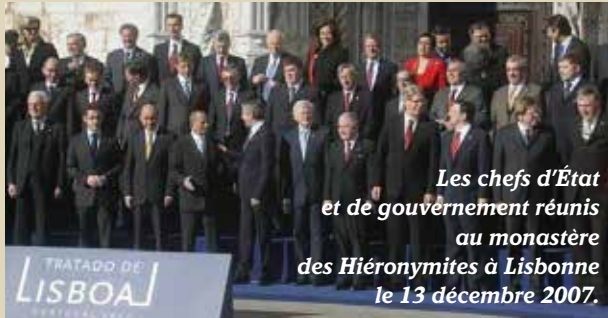
Les chefs d'État et de gouvernement réunis au monastère des Hiéronymites à Lisbonne le 13 décembre 2007.

Crainte de perdre l'identité de son pays, crainte de l'adhésion de la Turquie à l'UE, méfiance vis-à-vis de l'euro, étaient les principales raisons du vote en faveur du non. Mais les Hollandais, comme les Français, ont vu leur vote péti- tiné en décembre 2007 par la signature du Traité de Lisbonne.