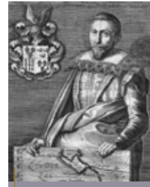
Jacob Le Maire (1585-1616) Il a découvert un passage à la pointe sud du continent américain, le Cap Horn