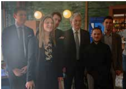
Jean-Paul Garraud dans le Var