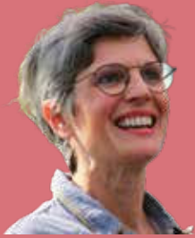
Sandrine Rousseau Député NUPES

« Le barbecue est un symbole de virilité »