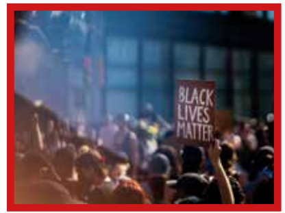
Black Live Matters, mouvement né en 2013 aux États-Unis qui milite contre le racisme « systémique » envers les Noirs.

Nous avons décidé d'ouvrir le dossier sur ce mouvement qui met en péril la France et l'Europe.