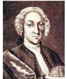
Jacob Roggeveen (1659-1729) À la recherche de Terra Australis, il découvrit l'Île de Pâques en 1722