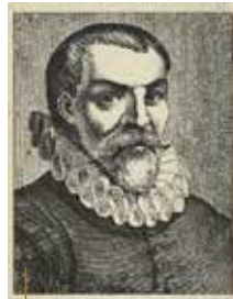
Willem Barentsz (1550-1597) Pionnier des expéditions dans les eaux du grand Nord, on a donné son nom à la mer du Barents

Les Pays-Bas sont une monarchie constitutionnelle, avec un régime parlementaire. L'actuelle monarchie a été fondée en 1813 quand les Français de Napoléon quittèrent le pays. Les Pays-Bas sont aujourd'hui composés de 12 « Provinces » (provinces). Dans un système où le Roi – aujourd'hui Guillaume Alexandre – assure surtout un rôle symbolique, la proportionnelle intégrale encourage l'émergence de nombreux partis et une culture de coalitions politiques.