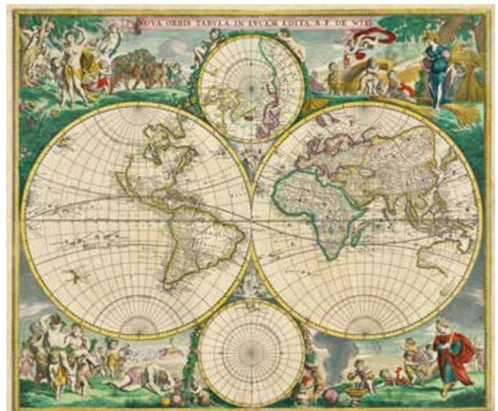
Nova Orbis (1670) Mappemonde de Frederik de Wit, cartographe néerlandais